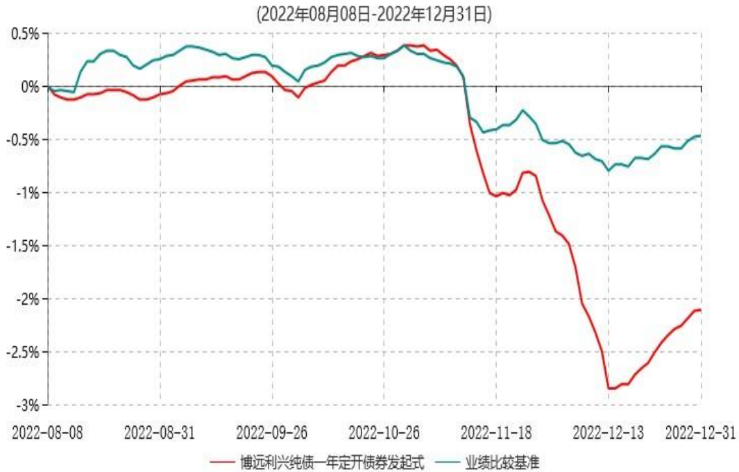
博远利兴纯债一年定期开放债券型发起式证券投资基金累计净值增长率与业绩比较基准收益率历史走势对比图

注：截至报告期末，本基金合同生效时间（2022年8月8日）未满一年。本基金合同规定，基金管理人应当自基金合同生效之日起六个月内使基金的投资组合比例符合基金合同的约定。