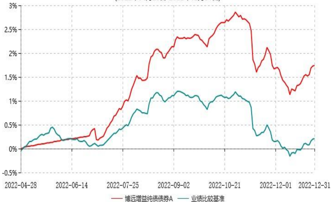
博远增益纯债债券A累计净值增长率与业绩比较基准收益率历史走势对比图 (2022年04月28日-2022年12月31日)