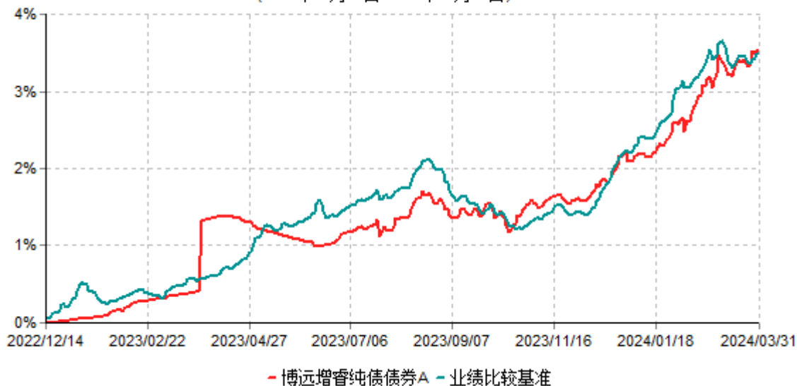
博远增睿纯债债券A累计净值增长率与业绩比较基准收益率历史走势对比图 (2022年12月14日-2024年03月31日)