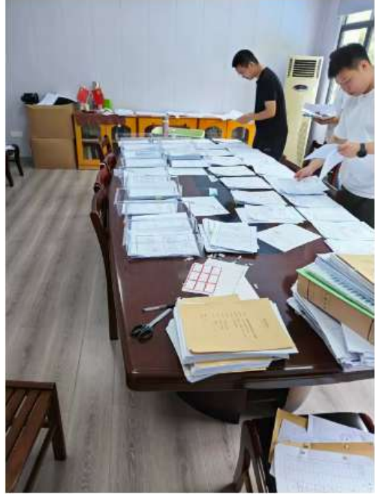
警方搜查涉案养老院现场