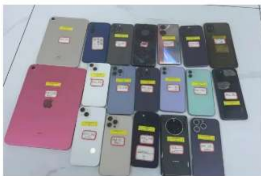
警方查获相关涉案物品