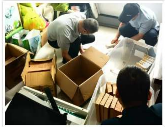
(搜查涉案公司现场)