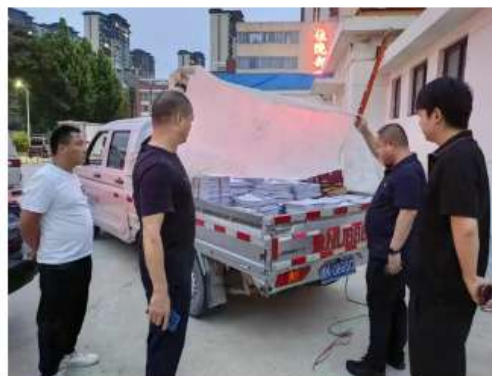
警方查获相关涉案物品