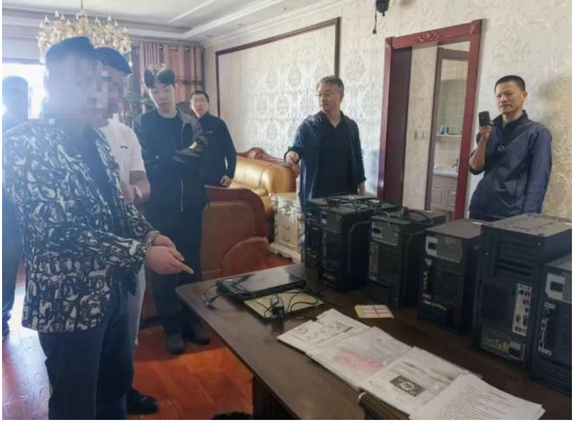
犯罪嫌疑人现场指认