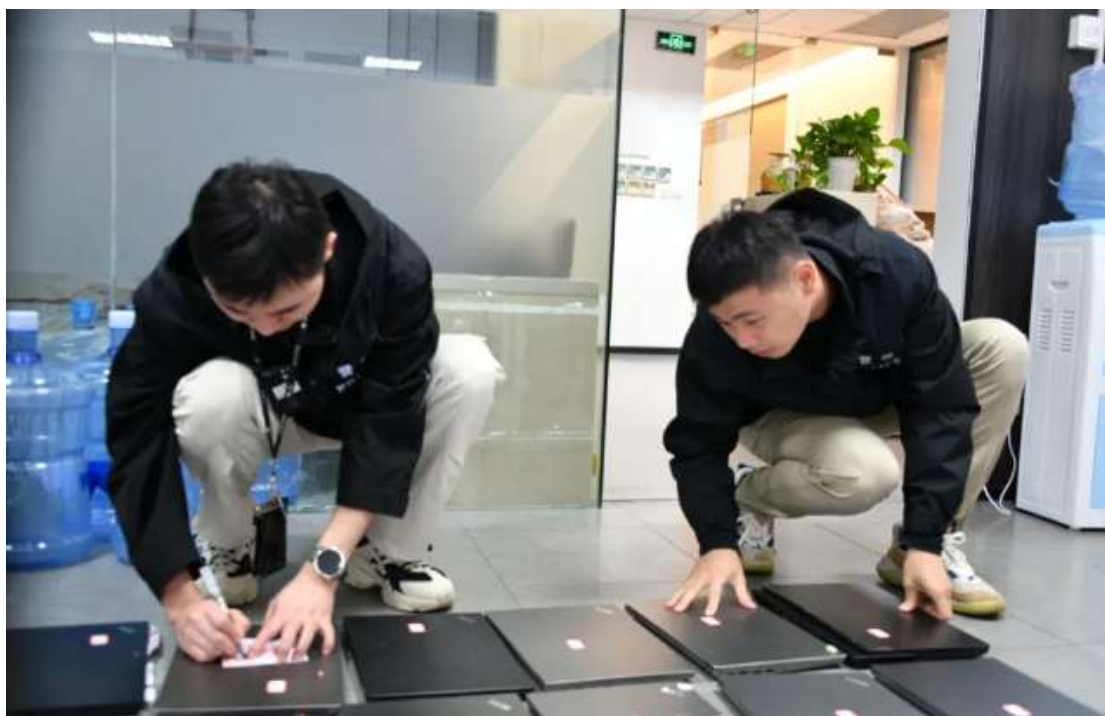
警方对涉案物品进行清点

免责声明：本文源于公众号公安部经侦局。仅用于投资者教育，投资者不应以该等信息取代其独立判断或仅根据该等信息做出决策。我公司对本文内容的准确性或完整性不作保证，亦不对使用该信息而引发或可能引发的损失承担任何责任。本文出于传播消息之目的，版权归原作者所有。如有侵权，请联系删除。